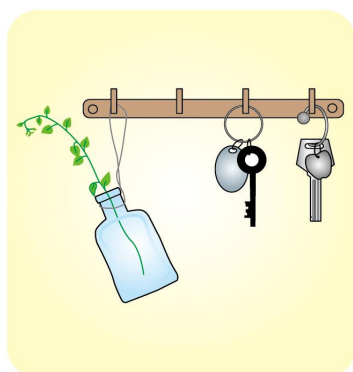
鍵は、玄関の壁にフックを設置して引っかけるのも良いですね。

マスクを出かけるとき、玄関にあると便利。そこで、玄関扉にマグネットフックで設置できるマスクケースなら、すぐに取り出せます。※電気錠の場合は動